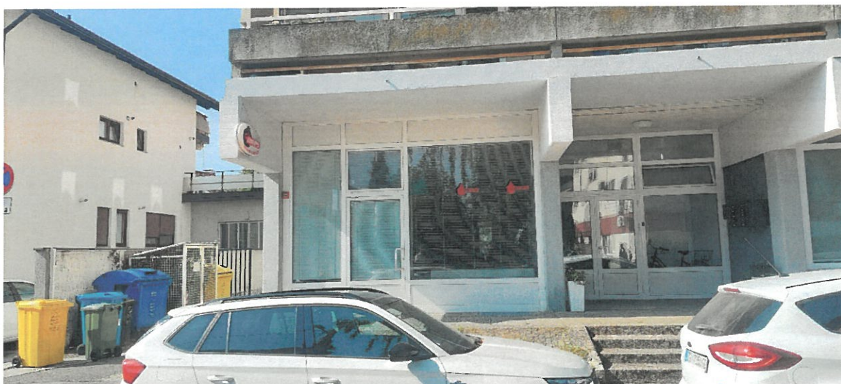
Ulaz u poslovni prostor