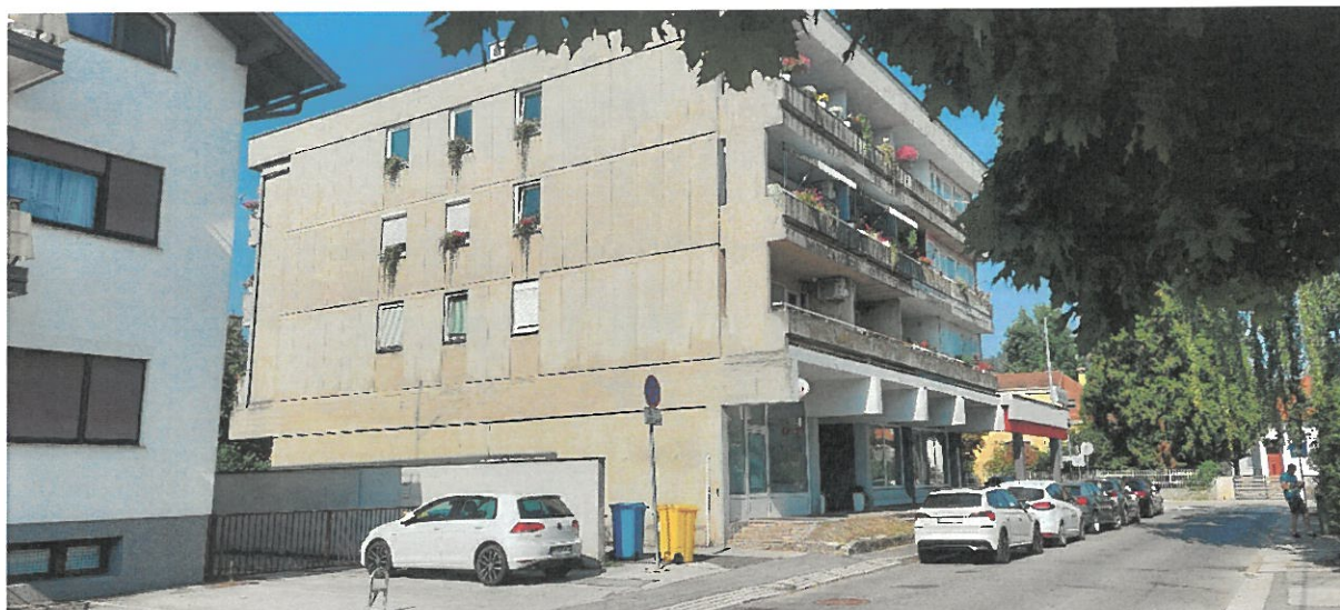
Stambeno poslovna zgrada Zagorska 2